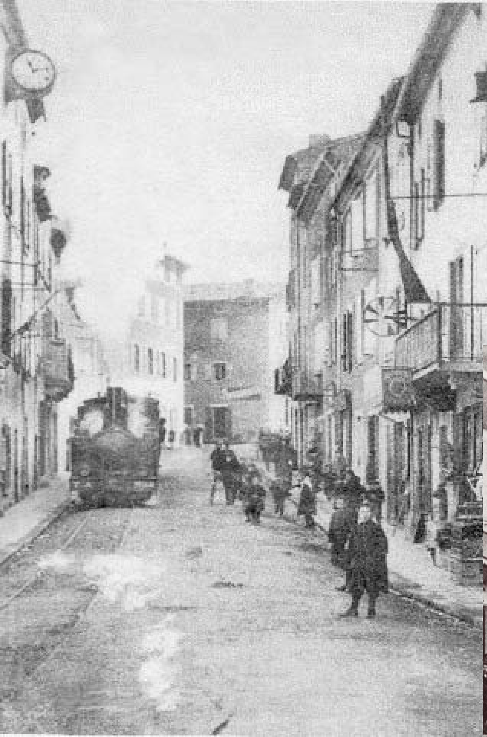
L'Ardèche Illustrée. - 1 - Les Vans - La Gare